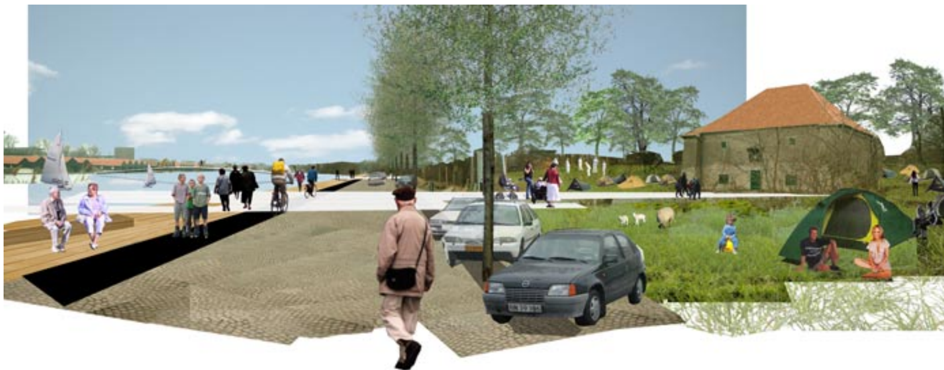
Promenaden langs Refshalevej og campingpladsen omkring Carls bastion.