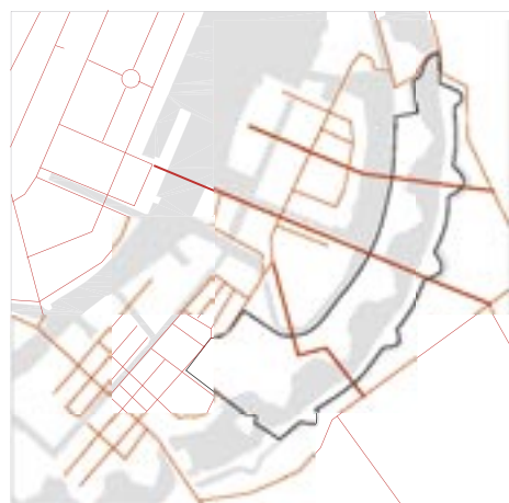
Veje og forbindelser