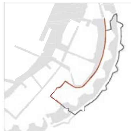
Bånd af lys