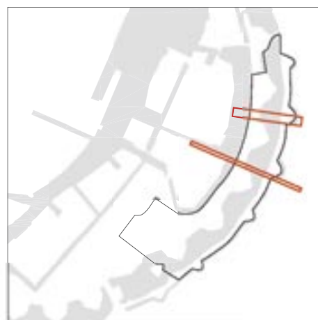
De historiske striber