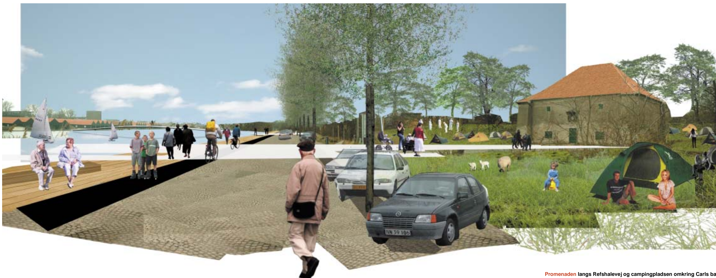
Promenaden langs Refshalevej og campingpladsen omkring Carls bastion.